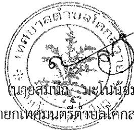
(นายสมนึก มะโนน้อม) นายกเทศมนตรีตำบลโคกสวาย

ประกาศ ณ วันที่ ๒ เดือน ตุลาคม พ.ศ. ๒๕๖๐